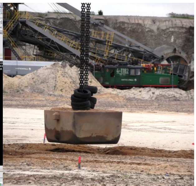
Bild 1 Auswertung der FG- Eindringtie- Bild 2 30 t – Fallgewicht fen